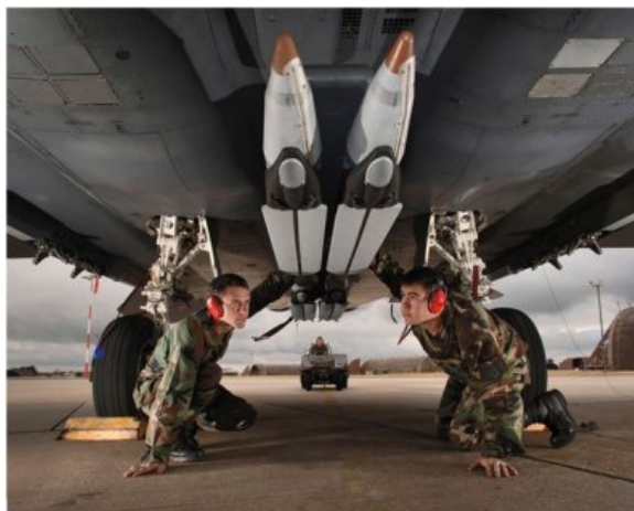
Casing of the GBU-39/B - Wings of the GBU-39/B in folded-back position

La SDB-1 ou GBU-39 a reçu sa certification en septembre 2005, sa production en série a débuté en avril 2006, et les premiers exemplaires ont été livrés à l'US Air Force début septembre 2006, en avance sur le calendrier et à un coût moins élevé que prévu.